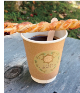
FG CHURRO ¥500

丹精込めて育てられた宇治の良質な抹茶を使った本格的な抹茶ラテ。抹茶本来の美しさを体感できます