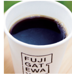
FILTER COFFEE ¥550 (HOT / ICE)