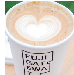
CAFE LATTE ¥550 (HOT / ICE)