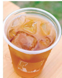
ROASTED GREENTEA ¥500 (HOT / ICE)