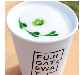
MACHA LATTE ¥700 (HOT / ICE)

ミルクと相性の良いオリジナルブレンドならではの香ばしさに牛乳が加わり、砂糖を加えていないのに甘みを感じます